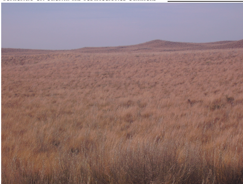
Figura 3. Pastizal pampeano occidental en el sureste de la provincia de Mendoza (35.42959° S, 66.81131° O), dominado por Elionurus muticus , Hyalis argentea , Sporobolus cryptandrus , Aristida mendocina , Bothriochloa springfieldii , Eragrostis lugens , Panicum urvilleanum y Poa lanuginosa (Tabla 1).

Figure 3. Pampa's grassland in Mendoza province, Argentina (35.42959° S, 66.81131° W). More common species are Elionurus muticus , Hyalis argentea , Sporobolus cryptandrus , Aristida mendocina , Bothriochloa springfieldii , Eragrostis lugens , Panicum urvilleanum and Poa lanuginosa (Table 1).