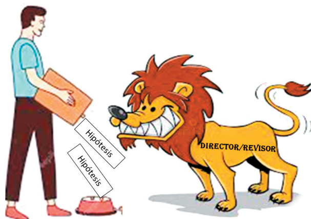
Figura 1. Ilustración metafórica de la exigencia, a veces injustificada, de incluir hipótesis en los proyectos de investigación en ecología. Este accionar muchas veces genera la inclusión de hipótesis inadecuadas que oscurecen el objetivo del trabajo, son lógicamente inviables de poner a prueba, determinan un diseño incorrecto, dificultan el desarrollo y la escritura del trabajo y generan un síndrome auto-inmune de rechazo al proyecto por parte del autor.

Incluir hipótesis cuando el estudio no lo requiere es una práctica tan nociva como no hacerlo cuando el estudio lo requiere. Como se discutió anteriormente, ciertos tipos de investigación no necesitan la formulación de hipótesis porque no ponen a prueba ideas ni intentan explicar la causa de un patrón. En