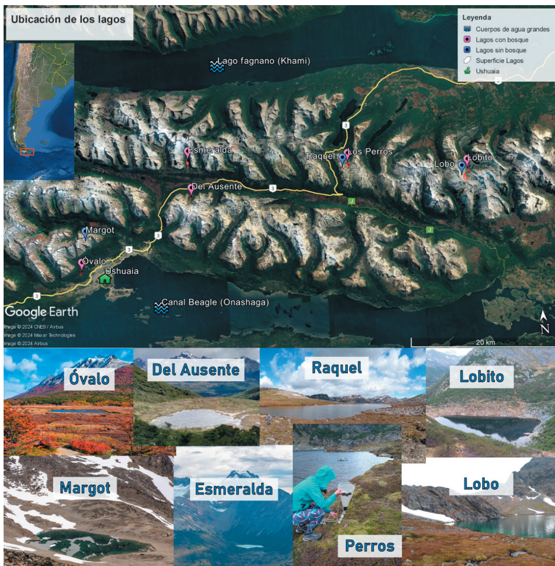
Figura 1. Mapa de los lagos estudiados en la zona cordillerana del sector argentino de Tierra del Fuego. En los paneles inferiores se muestran fotos de cada sitio.

Figure 1. Map of the studied lakes in southern Tierra del Fuego, Argentina. In the lower panels, pictures from each lake.