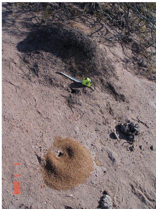
Foto 1. Nido de la hormiga cortadora Acromyrmex lobicornis . Se puede observar el domo externo del hormiguero formado por palitos y material vegetal seco (arriba) y su basurero externo en donde se depositan los restos vegetales no degradados por el hongo (abajo).

distinguible (Foto 1), son un importante aporte de materia orgánica al suelo, lo que favorece el ciclado de nutrientes y el establecimiento y desarrollo de la vegetación aledaña (Farji-Brener & Illes 2000).