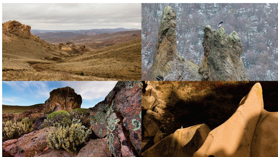
Figura 3. Ejemplos de roquedales y sus estructuras usadas por diferentes especies saxícolas (fotos: Gonzalo Ignazi).